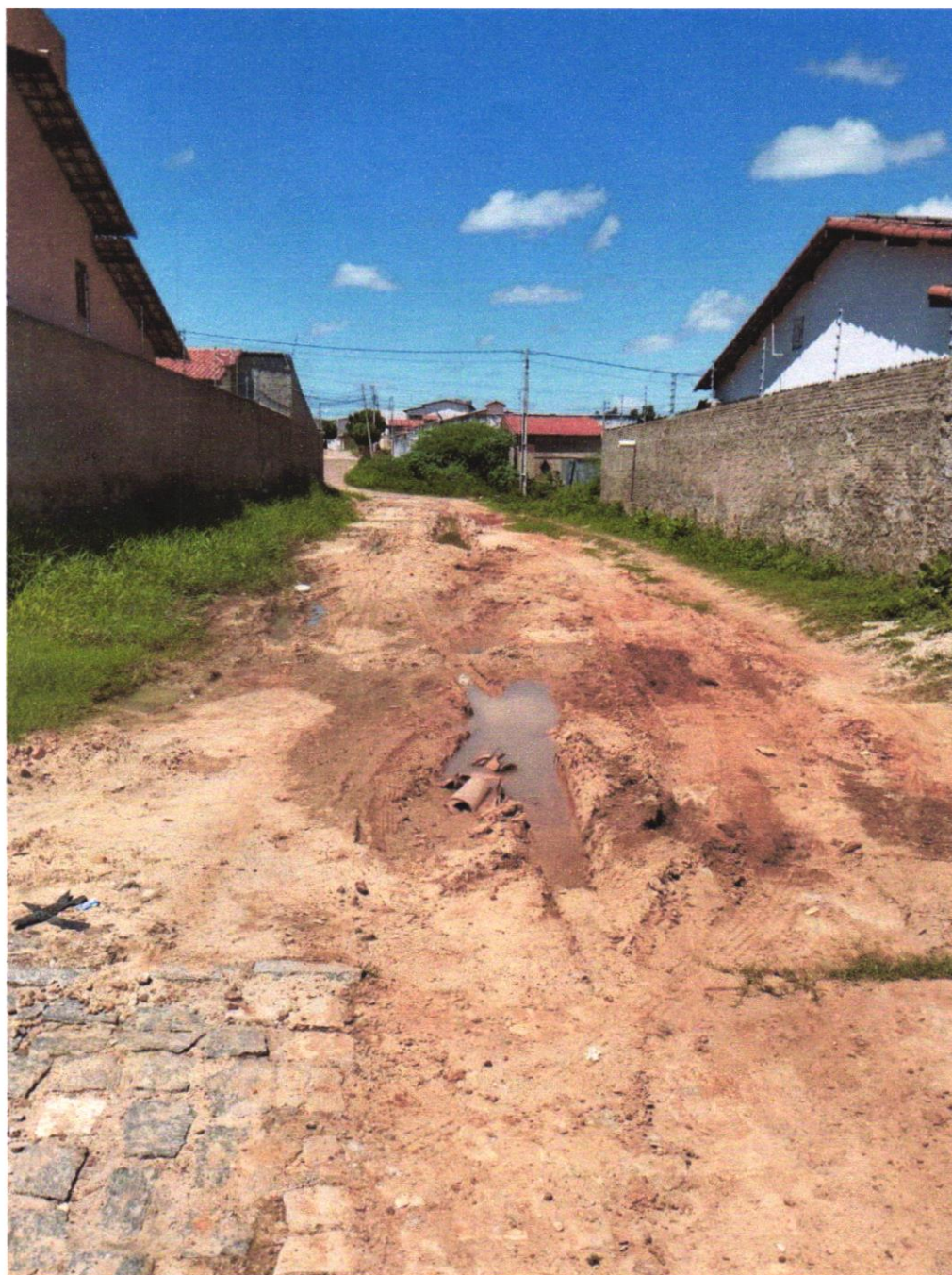
Foto ilustrando a situação da Rua Otávio de Souza Rêgo, no bairro Alto do Açude.