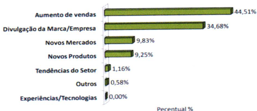
Gráfico 03 – Principais motivos que levaram a participação na feira